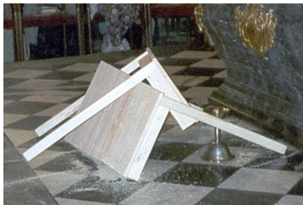
Der getrennte Tisch des Herren

Anmeldung im Stadthotel per Email ist möglich. Bitte als Kennwort „ARGE Ökumene“ dazuschreiben!